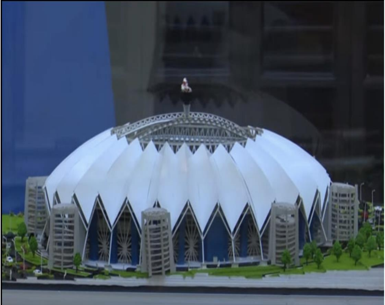
Dodoma Sports Complex