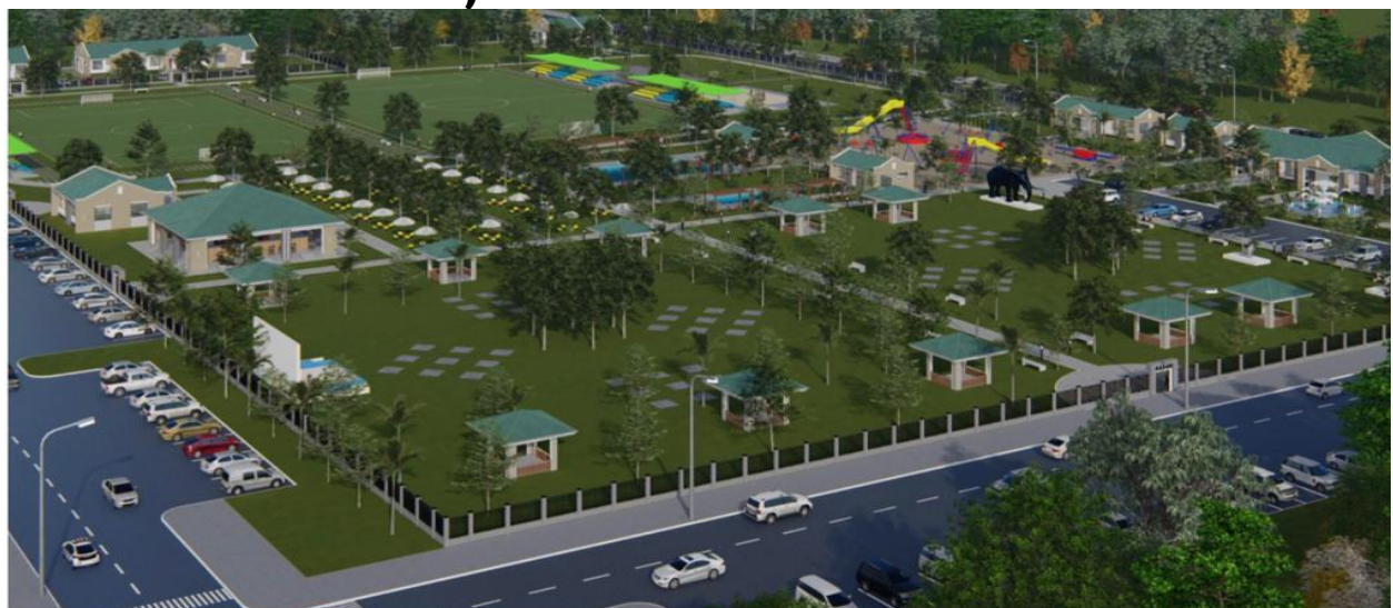
Recreational Centre Geita