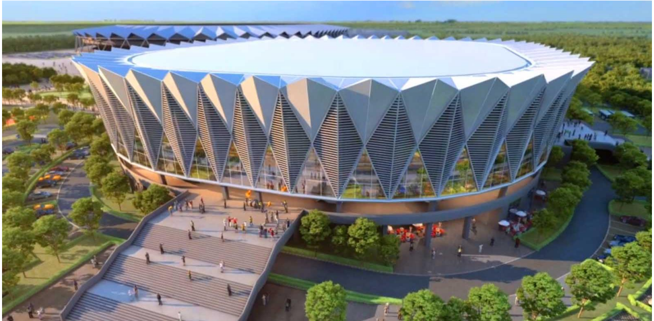
Sports and Arts Arena ya Dar Es Salaam