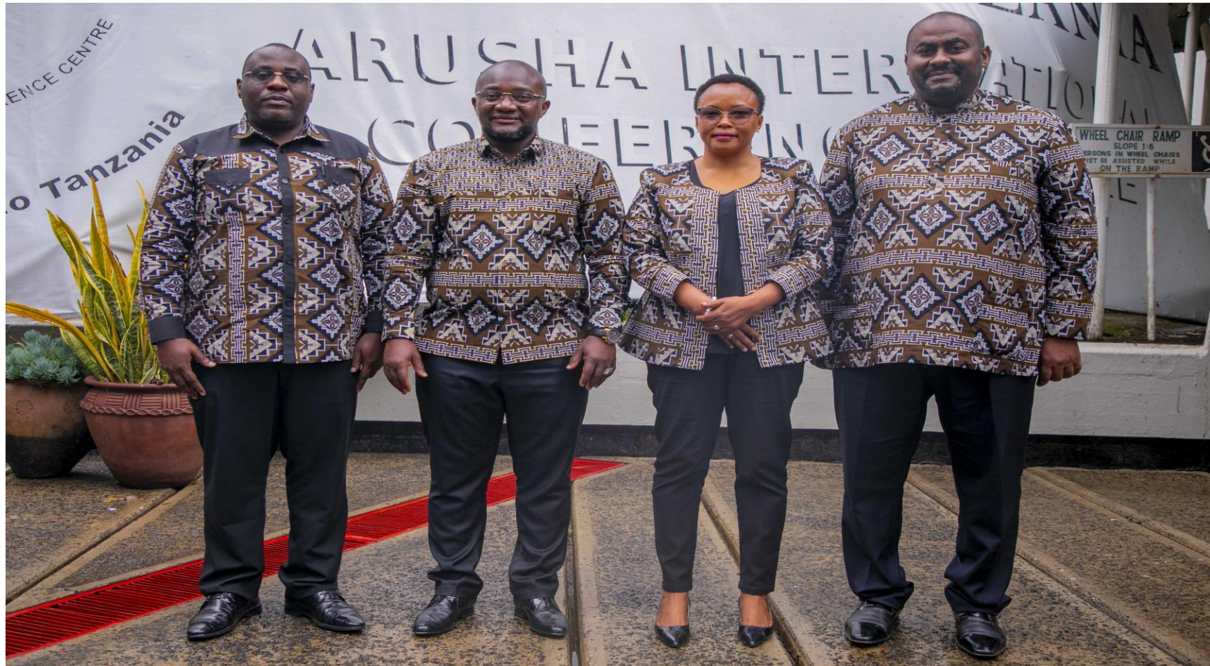
Viongozi wakuu wa Wizara ya Utamaduni, Sanaa na Michezo wakiwa katika picha ya pamoja wakati wa Kongamano la Idhaa za Kiswahili Duniani tarehe 14-18 Machi, 2022 Jijini Arusha.