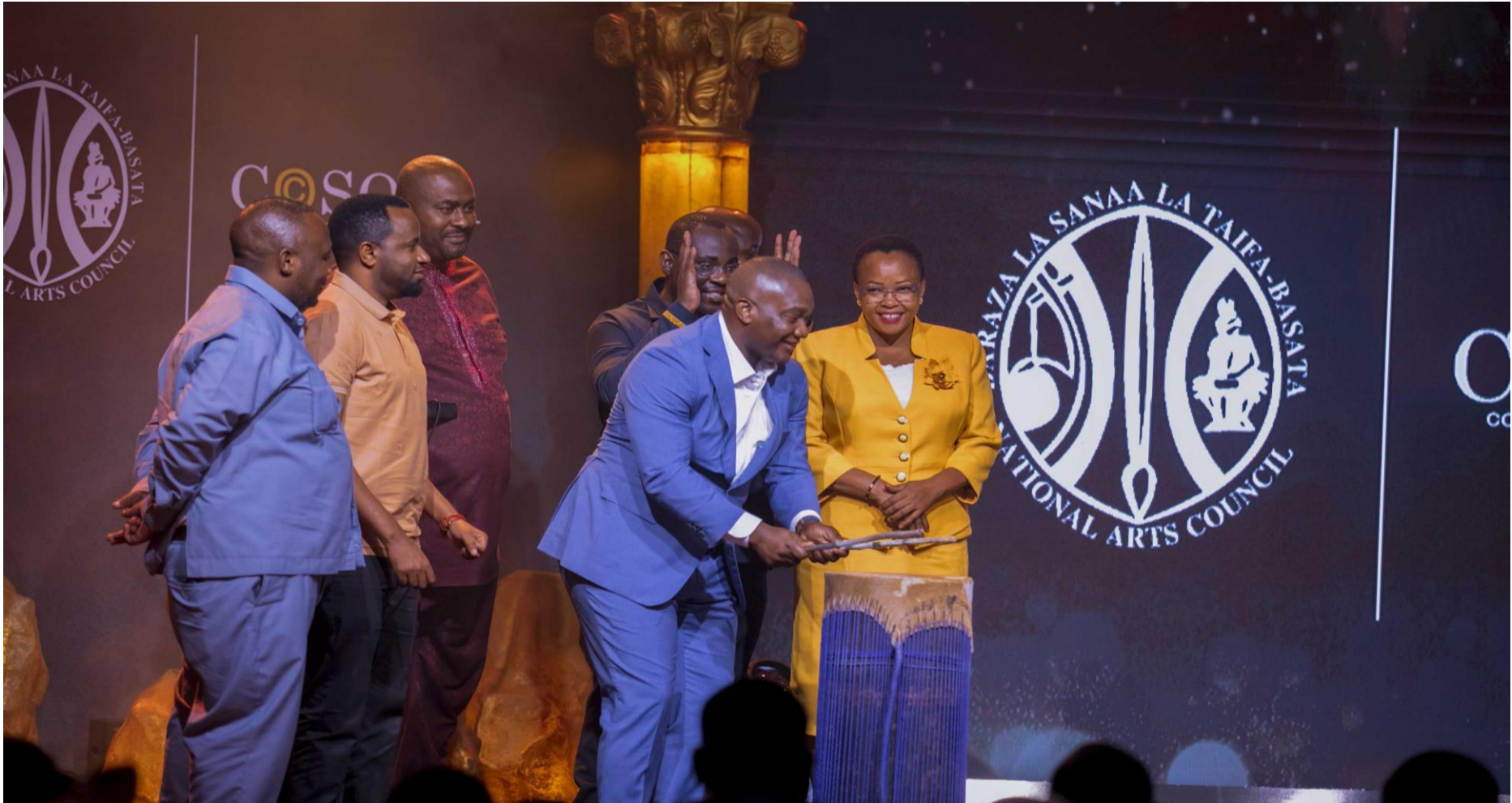
Waziri wa Utamaduni Sanaa na Michezo Mhe. Mohamed Omary Mchengerwa (Mb.) akipiga ngoma kuashiria uzinduzi wa utoaji wa Tuzo za Muziki tarehe 28 Januari, 2022 Jijini Dar es salaam.