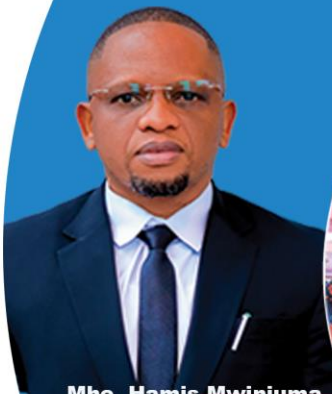
Mhe. Hamis Mwinjuma Naibu Waziri wa Utamaduni, Sanaa na Michezo