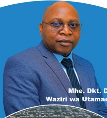
Mhe. Dkt. Damas Ndumbaro Waziri wa Utamaduni, Sanaa na Michezo